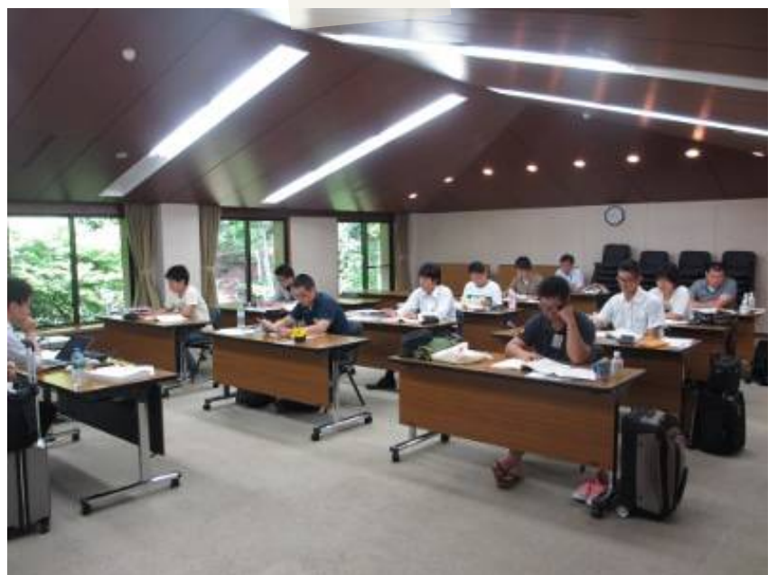
「日本ガス協会 近畿部会」様 研修風景