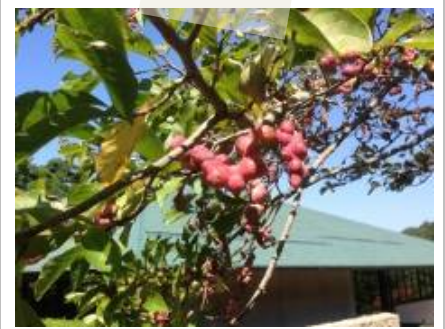
奥池の自然のひとつコマ

さて、今回の「奥池ロτζジだより」では、新しくなったもの ちょっとした変化などをご紹介しますと思います。