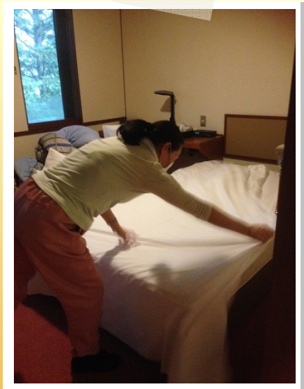
↑ ベッドメイキングの速さにびっくり！

ベッドメイキングはかなりの重労働なのですが いとも簡単に数分で完成！ 懇親会後にお部屋が汚れていることも多々あるとの ことですが、みなさんが綺麗なお部屋を維持できる ように努めてくださっています！ 本当に有難いことだと改めて感じました。 今後共どうぞよろしくお願ひいたします！