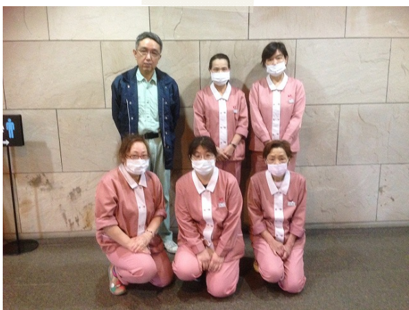
↑ みなさんいつも笑顔で素敵な方たちばかりです！

奥池ロτζジに勤めて長いのですが 共栄サービス様のお仕事を詳しく知ったのは 初めてでした。本当にお恥づかしい事です。