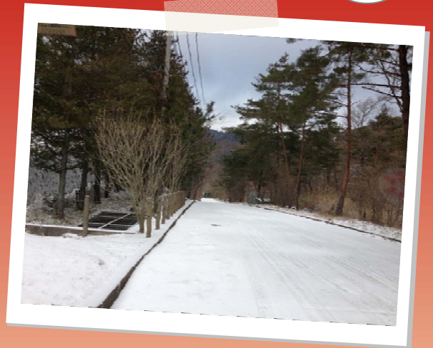
↑ 奥池は新年から雪景色でした。

宿泊室メンテナンスや研修室設営、館内の 至る所をお掃除していただいている 共栄サービス様のご紹介です。