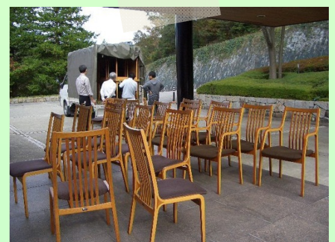
↑清潔感のあるテーブルと椅子になりました！