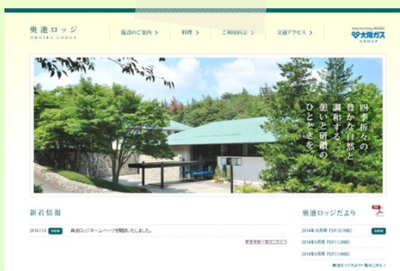
HPも開設されました。↑