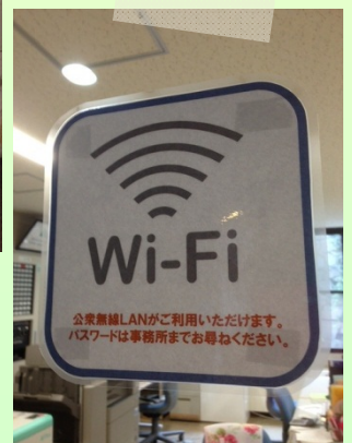
WiFiが設置され、さらに便利に！→

食堂のテーブル・椅子につきましては ・箕面こどもの森学園様(箕面市・子ども支援) ・のあつく自然学校様(枚方市・子ども支援) ・燦然会様(大阪市城東区・障がい者支援) 上記の支援団体様に寄付させていただける機会にも恵まれました。