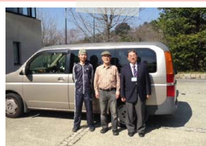
← 今回のデスクは NPO法人 箕面こどもの森学園 様 に寄付させていただける ことになりました！

当施設が、たくさんの事を学び「懐かしいなあ・・・」 と振り返ることができる思い出深い施設となれるよう 日々努力してまいりたいと思います。