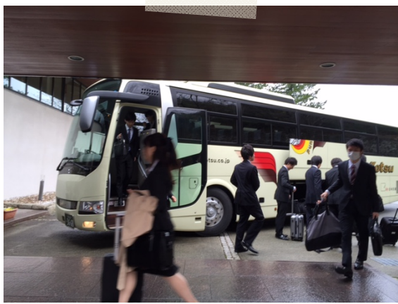
バスから降りてくる新入社員の方々。元気な挨拶が印象的でした！