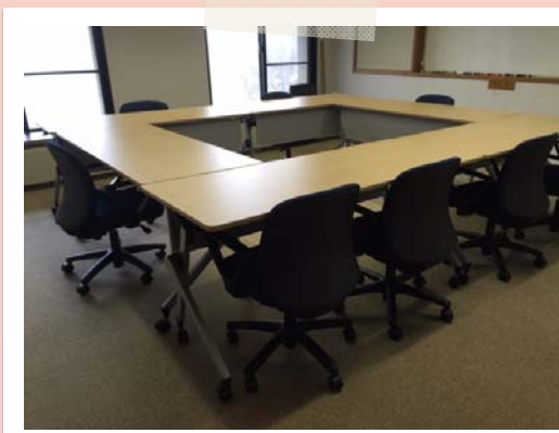
↑ 清潔感のあるデスクとチェア！

そして、奥池ロτζジにも新しい設備が導入されております。 研修室には新しいデスクとチェア。そして蛍光灯からLED照明への切替工事が行われ トイレにはエアタオルが設置されました。少しずつではありますが、奥池ロτζジも成長中！